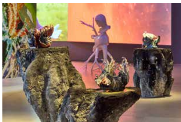
Installationsansicht 3: Nina Paszkowski, „Ventress“, 2024, „Anomas-Serie“, 2024-25, „how to hold a void 3/3“, 2023, Keramik, Troika, „Phoenix Faun“, 2024, 3D-Druck, Eva Papamargariti, „Mutants, Crawlers, Shapeshifters I“, 2025, Videos und Textilien, und Federico Cuatlacuatl, „Xochipitzahuatl-Nova“, 2024, Video, © Nina Paszkowski, Troika, Federica Cuatlacuatl und Eva Papamagaritit, Foto: Jürgen Vogel / LVR