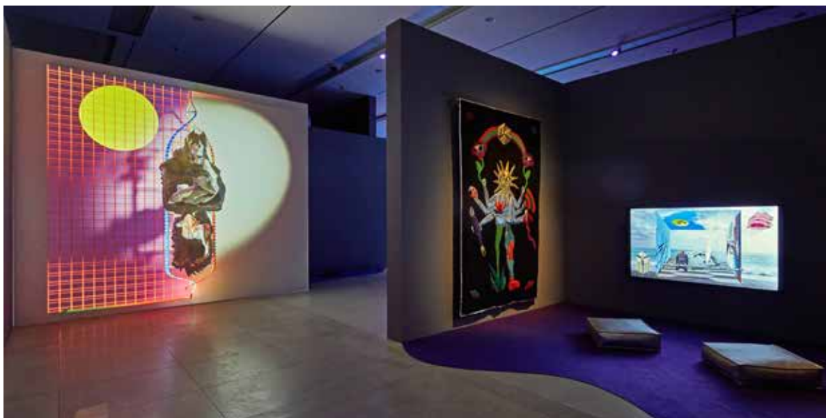
Installationsansicht 1: Kévin Bray „BullBear Dynamics“, 2025, und Angelo Pleassas, „Meditation of All Beings“, 2022, und „The Quilt of Alle Beings“, 2022, © Kévin Bray und Angelo Pleassas