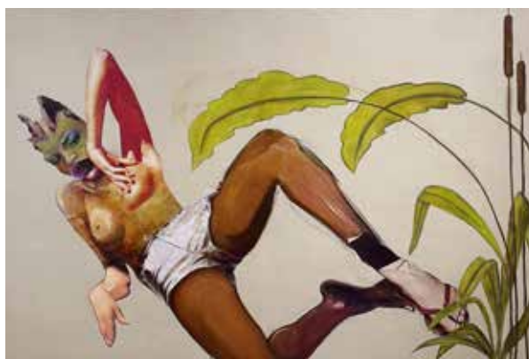
Pressebild 6: Anys Reimann, „L'APRES MIDI D'UNE FAUNA“, 2024, Mixed Media-Collage und Öl auf Leinwand, Sammlung AGLAIA