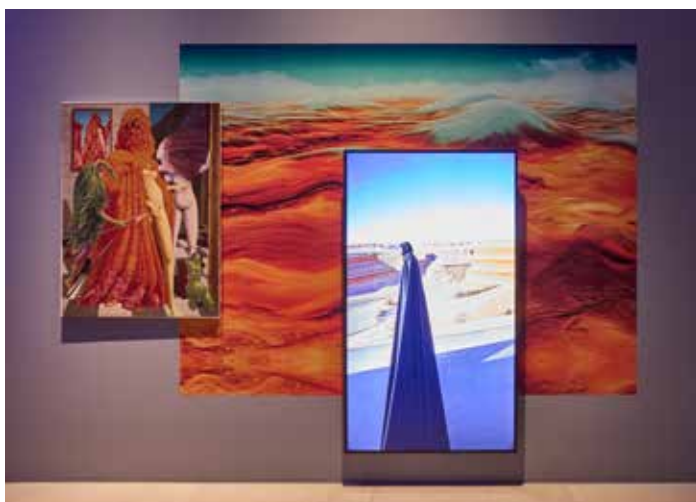
Installationsansicht 4: Anne Horel, „Xenobiome.exe“, 2025, Installation, sowie Max Ernst, „Die Einkleidung der Braut“, 1973, Farbserigrafie in Öl auf Leinwand, © VG Bild-Kunst, Bonn 2025, Foto: Jürgen Vogel / LVR