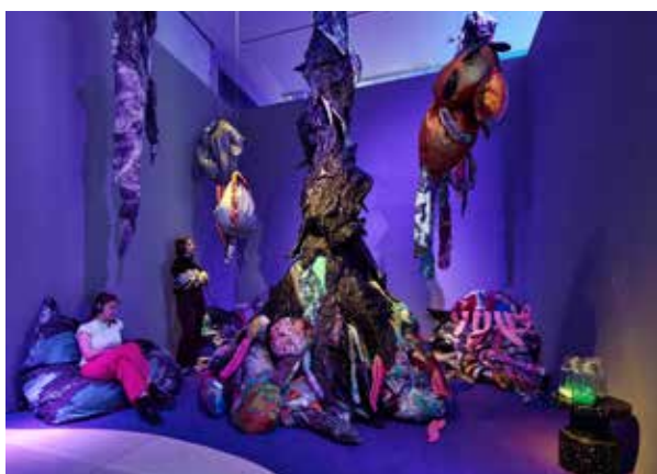
Installationsansicht 2: Lex Rütten und Jana Kerima Stolzer, „LUCA“, 2025, Hörstück, Kopfhörer, Sitz- und Stoffobjekte, Präparatgläser, © Lex Rütten & Jana Kerima Stolzer, Foto: Jürgen Vogel / LVR