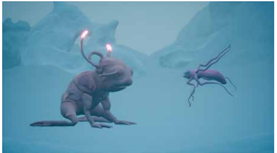
Pressebild 8: Mary-Audrey Ramirez, „Forced Amnesia“, 2023-24, Computerspiel, Farbe, Ton, 25-30 Min, © Mary-Audrey Ramirez