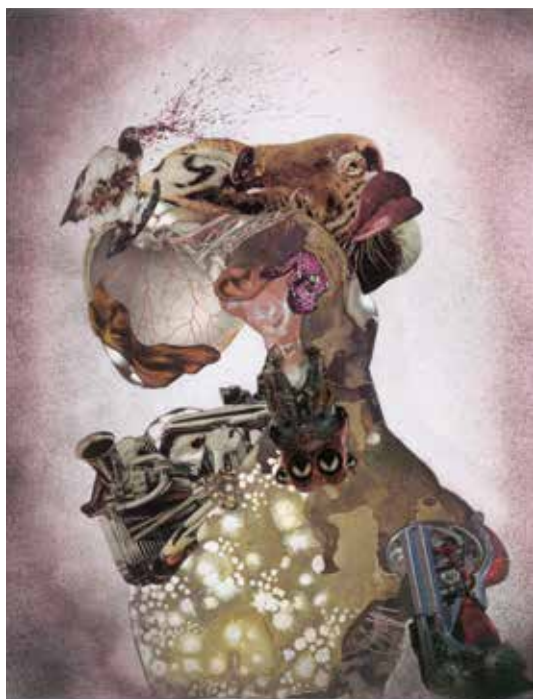
Pressebild 5: Wangechi Mutu, „Homeward Bound“, 2009, Sammlung Deutsche Bank, Courtesy of the artist und Vielmetter, Los Angeles, Foto: © Robert Wedemeyer