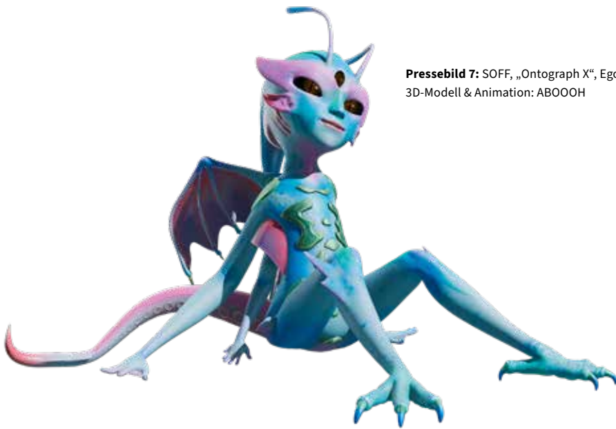
Pressebild 7: SOFF, „Ontograph X“, Ego-Konzept: SOFF, 3D-Modell & Animation: ABOOOH