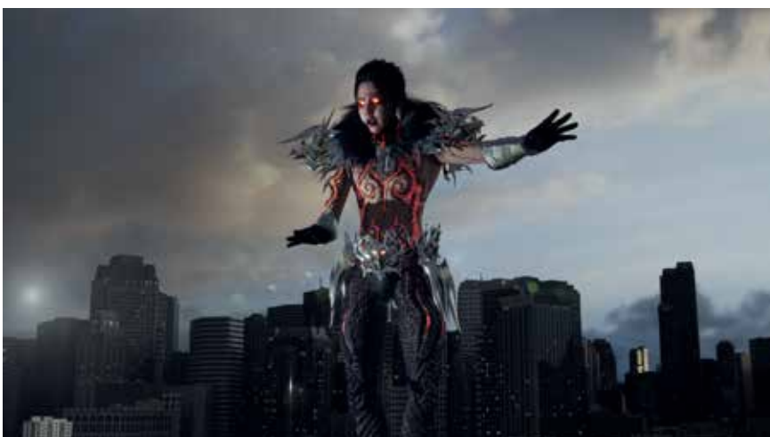
Pressebild 9: Lu Yang, „DOKU – Binary conflicts invert illusions“, 2022, 1-Kanal-Video, Farbe, Ton, 4:33 Min