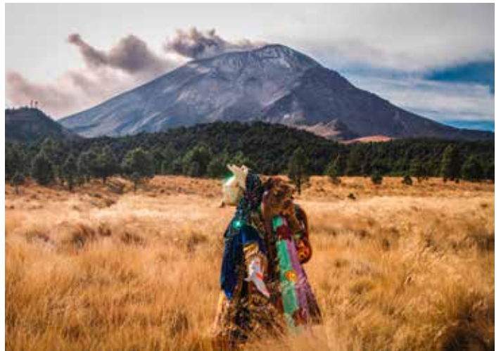
Pressebild 1: Federico Cuatlacuatl, „Xochipitzahuatl-Nova“, 2024, 3-Kanal-Videoinstallation (Still)