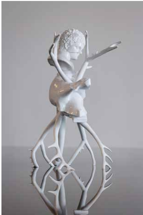
Pressebild 4: Troika, „Phoenix Faun“, 2024, Courtesy MAK Contemporary, Foto: © kunst-dokumentation.com/MAK