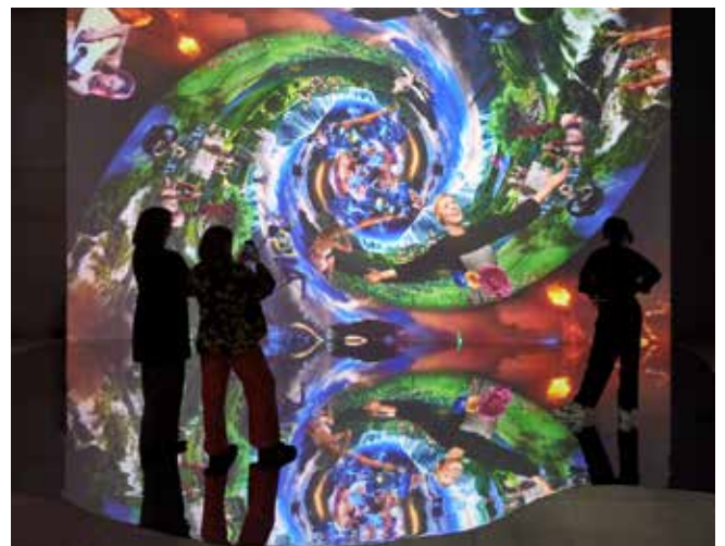
Pressebild 2: Marco Brambilla, Installationsansicht von „Creation (Megaplex)“, 2012, 4K-Video, Farbe, Ton, Loop: 4 Minuten, © Marco Brambilla