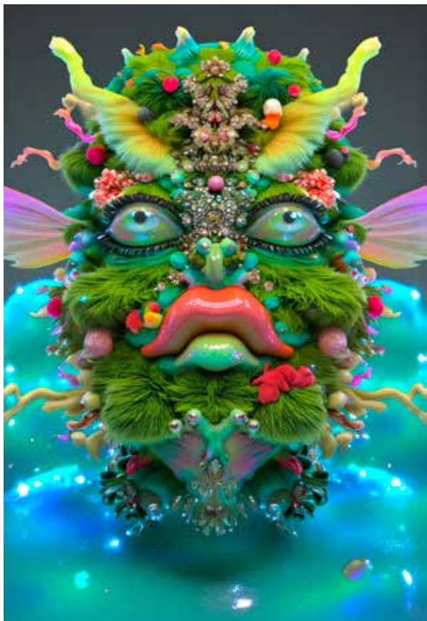
Pressebild 3: Anne Horel, „Lepidodinium Chlorophorum“, 2024, generiert mit LoRA, das mit Kreaturen aus einem überholten experimentellen OpenAi-Modell trainiert wurde, Foto: © Anne Horel